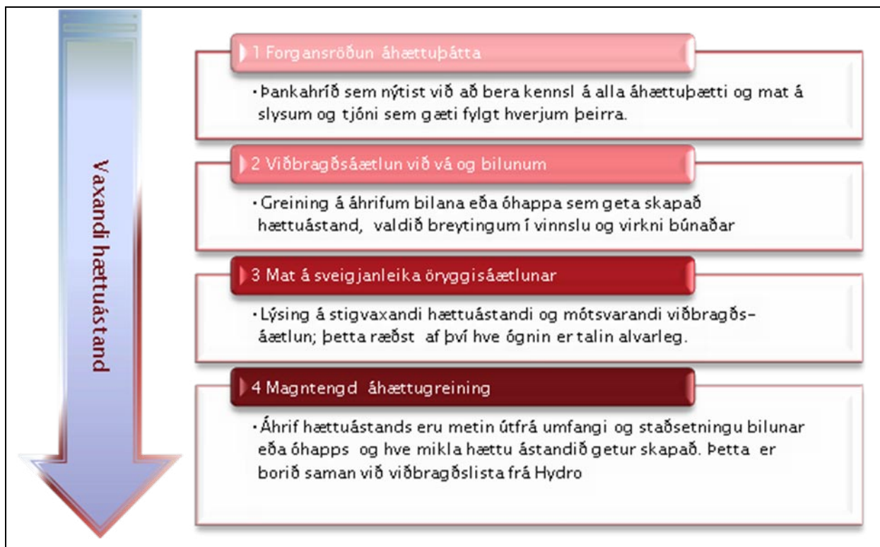
Mynd 1 Þrep áhættumats og undirbúningur fyrir öryggisáætlun, sjá einnig mynd á ensku í lok inngangsins bls 10

Þessu misræmi hefur veist framleiðendum erfitt að mæta; tankar sem henta í einu landi eru bannaðir annars staðar og bílar sem eiga að ganga fyrir vetni eiga ýmist að mæta sérreglum fyrir vetni eða fylgja ákvæðum um metangas og sækja um leyfi frá fjölmörgum stofnunum á hverjum stað. Á sama tíma er opnað fyrir almenna bílaumferð yfir landamæri landa í Evrópusambandinu. Fyrirtæki sem taka að sér að smíða búnað fyrir vetnisafyllingastöðvar höfðu því mælst til þess að settur yrði fram einn staðall fyrir öll löndin til þess að hanna og fjöldaframleiða vetnisbúnað sem stenst öryggiskröfur í öllum Evrópulöndum. Þetta er upphafspunktur vinnunnar við vetnisstöðvahandbókina.